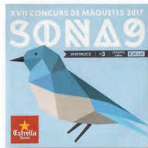
SONA 9 (2017)