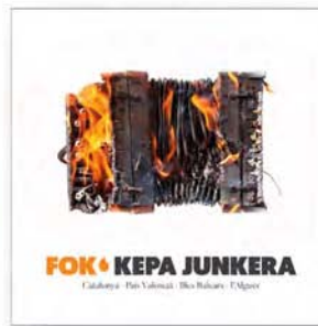
FOK, KEPÀ JUNKERA (Satélite K, 2017)