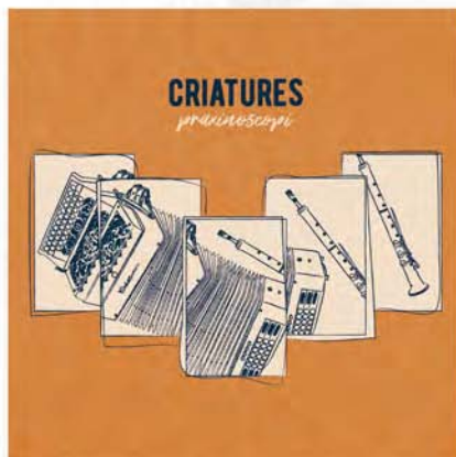
PRAXINOSCOPI (Microscopi, 2019)