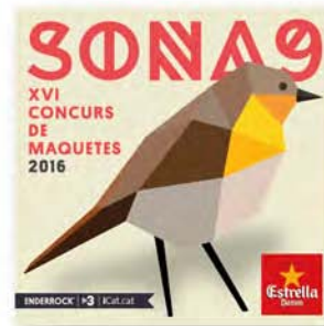
SONA 9 (2016)